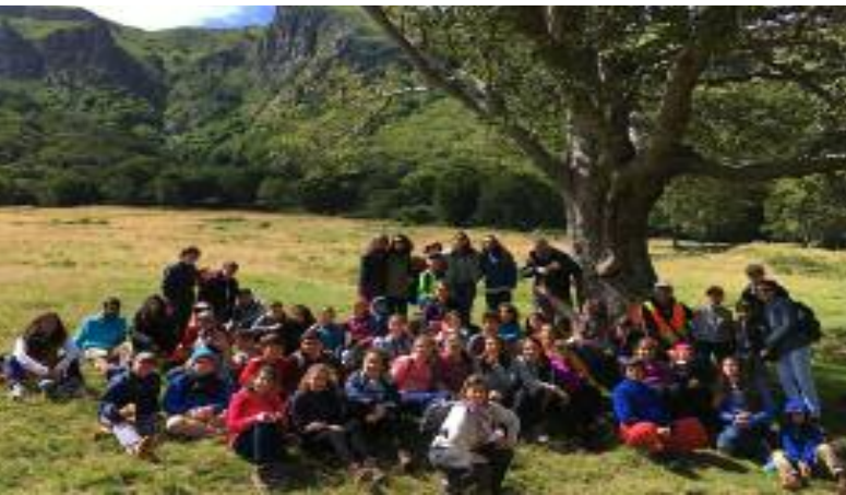
Le regroupement du premier jour de Zarmanazan 40 enfants et 15 moniteurs

Le Département des Communautés arméniennes de la Fondation Calouste Gulbenkian se préoccupe de l'apprentissage aux enfants de l'arménien occidental. Une colonie de vacances est créée pour que les enfants arméniens de 12 à 16 ans originaires de la Diaspora (Autriche, Belgique, Canada, États-Unis, France, Turquie), se retrouvent en immersion totale de l'arménien occidental dans un milieu créatif et ludique. Cette colonie a eu lieu dans une charmante ville auvergnate, La Bourboule , durant quatre semaines du 17 juillet au 11 août 2017. Cette animation a été assistée par l' Institut National des Langues et Civilisations Orientales et l'association Mille et un mondes , de Lyon, et a obtenu l'aval du Ministère de la Jeunesse et des Sports .