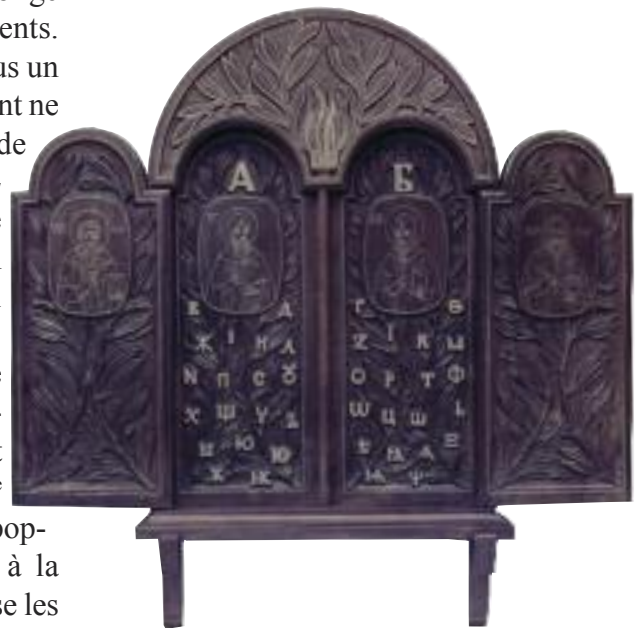
Panneau-triptyque dédié à la création de l'alphabet slave.