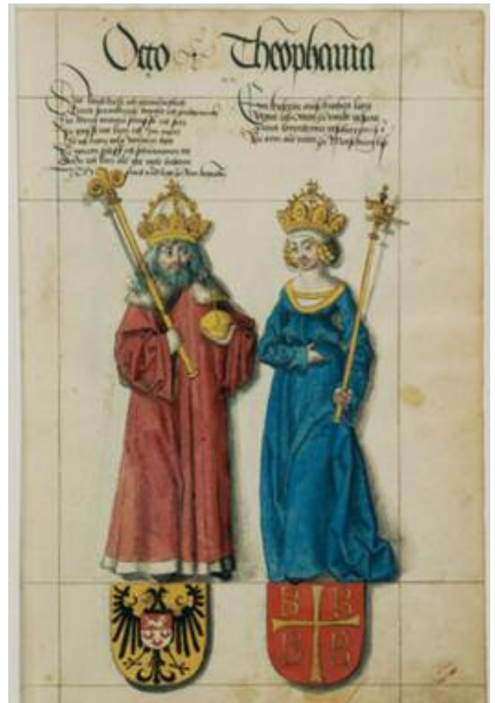
Otton II et Théophano, Bibliothèque nationale de Saxe - Bibliothèque nationale et universitaire de Dresde, XV e siècle

Exemple de ce que vous pouvez voir sur le site Internet : www.theophano.com