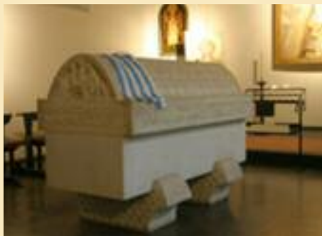
Sépulture de Théophano dans l'Église St-Pantaléon de Cologne.

Sur les traces de Theophanu/Theophano Skleraina, princesse arménienne de la dynastie macédonienne, qui, au X e siècle, devint impératrice du Saint Empire romain germanique par son mariage avec Otton II. Un destin hors du commun au Moyen Âge.