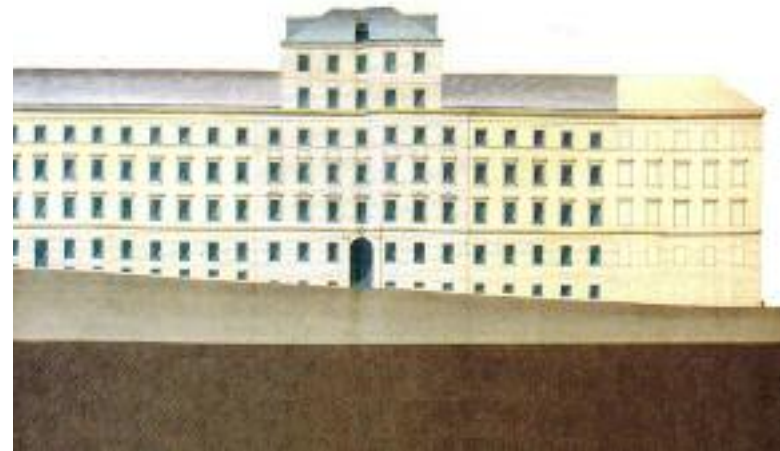
Couvent Mekhitariste, 1836, Mechitaristengasse 4, Vienne VII (Autriche)

L'œuvre de Mechithar (1676-1749) est bien connue. La contribution de son ordre au redressement du peuple arménien est indéniable et est hautement appréciée. Mais on a tendance à se focaliser sur la seule Maison de Venise, dans l'île saint Lazare, et on ignore souvent l'autre branche qui s'est installée depuis 1811 dans la capitale des Habsbourg, à Vienne (Autriche).