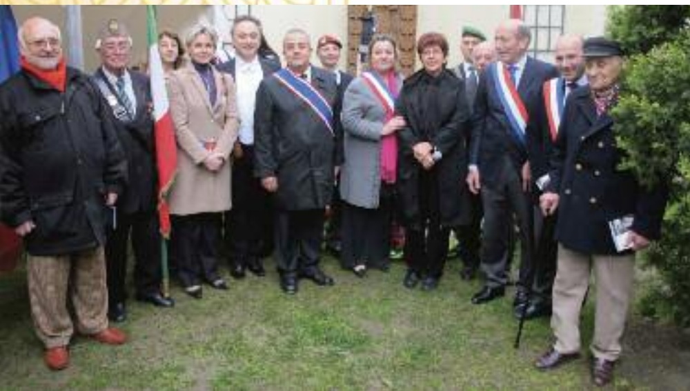
Photo souvenir avec les participants de la cérémonie.