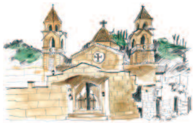
Dessin de Véhanouche BAliAN L'Église protestante arménienne de Kessab (Syrie)