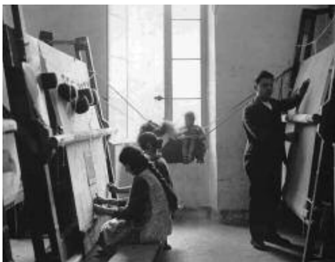
Un des ateliers de la société Tapis France Orient, Marseille années 30