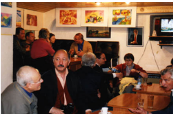
Rencontre avec des Arméniens de Plovdiv